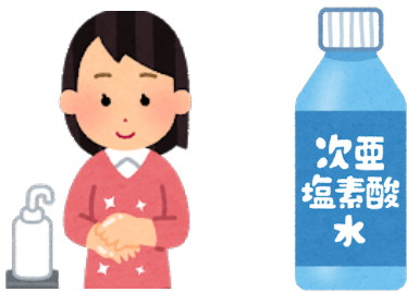
アルコール・次亜塩素酸水による 手指と、触れた場所、備品の消毒