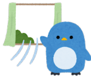
事務所内の定期的な換気と 施術中の換気をお願い