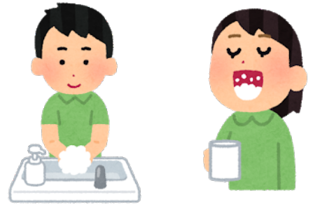
手洗いうがいの徹底