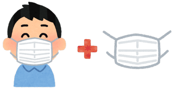
マスクを二重で着用