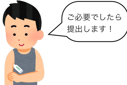
毎朝の体調・検温チェック